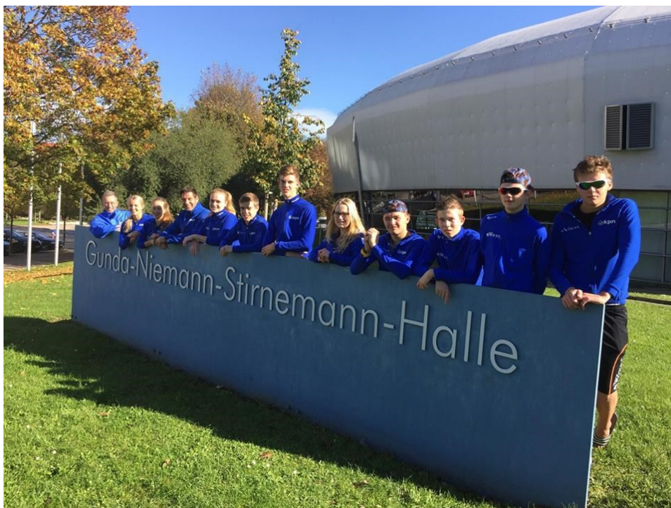
De schaats(t)ers van de Baanselectie 2014/2015 Trainingskamp in Erfurt bij de ijsbaan, de Gunda Niemann Halle.